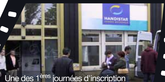
Une des 1 ères journées d'inscription