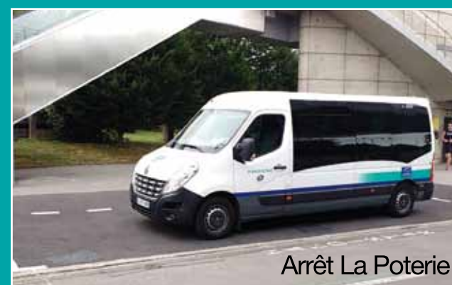
Arrêt La Poterie