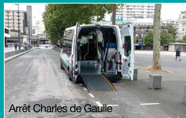
Arrêt Charles de Gaulle